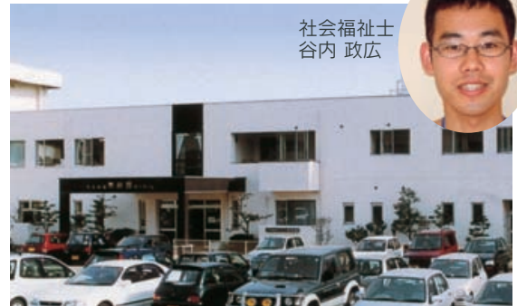
社会福祉士 谷内 政広

家庭的な雰囲気づくりをモットーに、日常生活（食事・排泄・入浴など）が困難な方々に対し介護を行っております。個人の尊厳を重視し、利用者の皆様にどれだけ満足していただけるか日々追究して、個別ケアの実践に取り組んでおります。