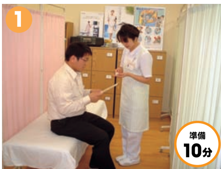
胃をきれいにする薬を最初に飲みます。内視鏡を飲みやすくするために、ノドの奥を麻酔します。