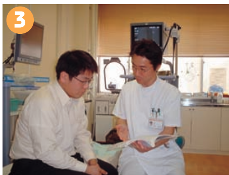
検査の結果について専門の医師が分かり易くご説明いたします。短い時間で的確な診断が行えるのが内視鏡検査の優れた点です。