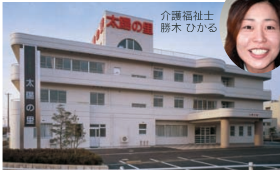
介護福祉士 勝木 ひかる

明るくアットホームな雰囲気を心がけ、 ○利用される方の想いを尊重して ○1人ひとりの自立を支援して ○地域社会への貢献をめざして 介護が必要な利用者の皆様とご家族の「生き方」を「まごころを込めて」応援いたします。