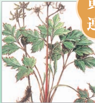
オウレン (キンポウゲ科)

根茎は多数の細根をつけ、黄色で、 なめると苦く、主根茎を薬用とす る。苦味健胃薬等単味でも薬用と する。