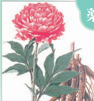
シャクヤク (ボタン科)

根を薬用として用いる。鎮痛、鎮 痙、駆瘀血作用がある。薬用種と しては一重の白花種を好んで栽培 する。