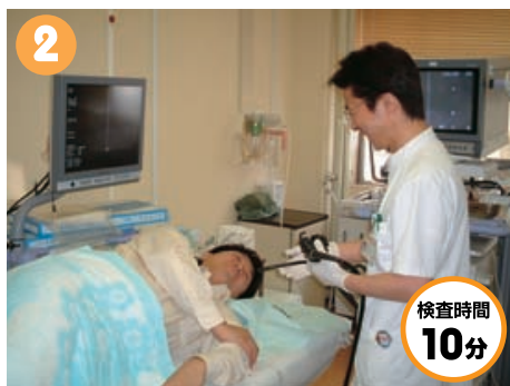
内視鏡をムリに飲みこもうとせず、医師の指示に従って軽い気持ちで飲みこみます。